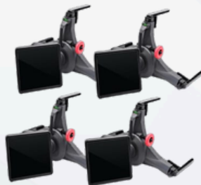
4 pinces de fixation à 3 points avec cibles incluses