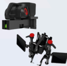
2 supports muraux pour 2 supports de serrage à 3 points, support mural pour unité de mesure