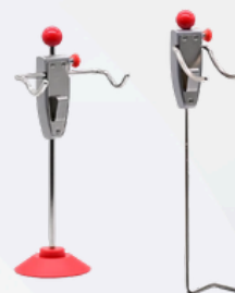
1 x Bloque-volant 1 x Bloque-pédale de frein