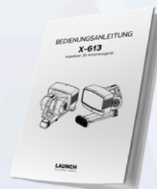
Manuel d'utilisation en français