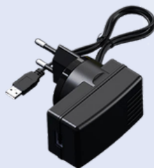
1 câble d'alimentation (UE), 1 adaptateur secteur,