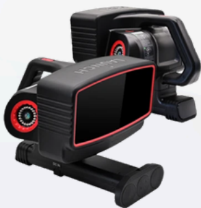
2 unités de mesure magnétiques