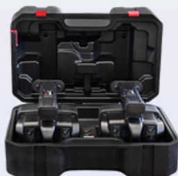
1 x étui de transport de protection